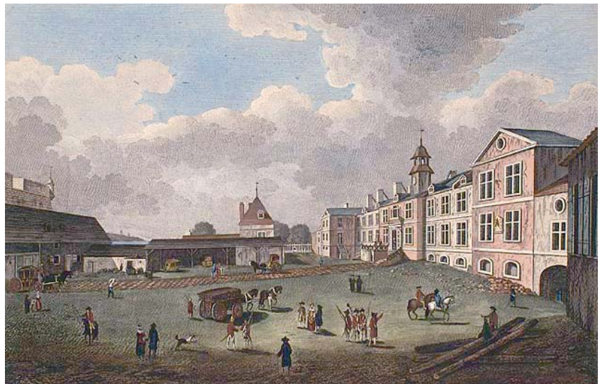
La cour des palais de l'intendant en des temps glorieux