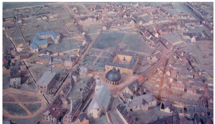
Un aperçu de la maquette Duberger construite en 1880

C'est sur cette belle leçon de la petite histoire de Québec que les participantes et les participants se dirent À la prochaine.