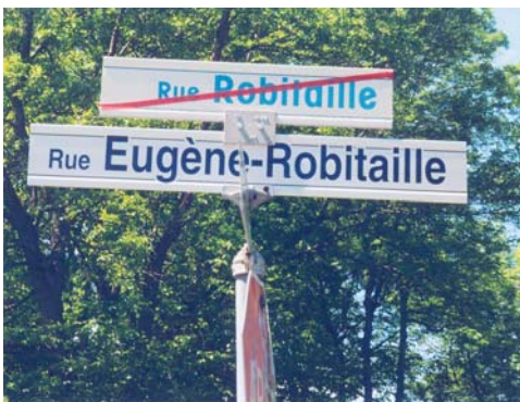
Panneau routier montrant le changement d'appellation de la rue

NDLR : L'histoire de la famille d'Eugène Robitaille a aussi été publiée dans le 48 e numéro des Robitalleries, Les Robitaille à Cap-Rouge (2 e partie).