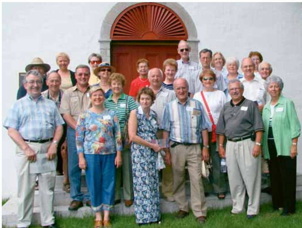
Groupe de l'Association en face de la petite chapelle Sainte-Anne à Neuville, lors de l'épluchette de blé d'Inde du 14 août 2005

Dans la très grande majorité des cas, les membres d'une association de familles ainsi que leurs conjoints et conjointes sont des porteurs du patrimoine. J'ai la vague impression qu'il est plutôt rare qu'une personne adhère à une telle association en fonction du patrimoine de sa mère. À mon humble avis, c'est une lacune qui mérite d'être soulignée et ... corrigée car, dans le sang de chaque être, il y a autant de gênes qui proviennent de la mère que ceux qui proviennent du père.