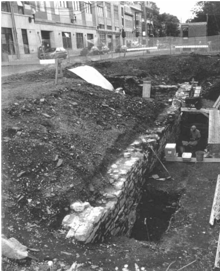
Site de fouilles archéologiques en bordure de la rue Saint-Vallier.

Ces notes généalogiques ont été tirées du livre I Généalogie Robitaille de René Robitaille de L'Ancienne-Lorette.