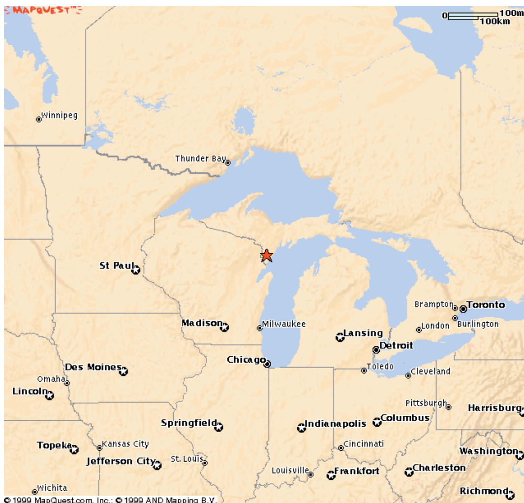
L'étoile au centre indique l'emplacement du village de Stephenson situé au Michigan, près de la frontière du Wisconsin, au nord-ouest du lac Michigan, à 1300 km de Montréal