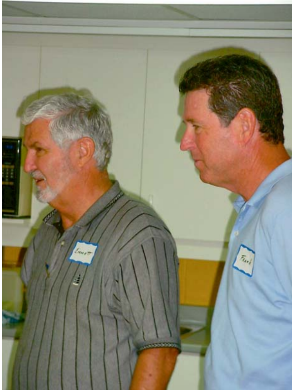
Emmett du Texas et Frank de Californie

états financiers à la maison Raymond Chabot Grant Thornton.