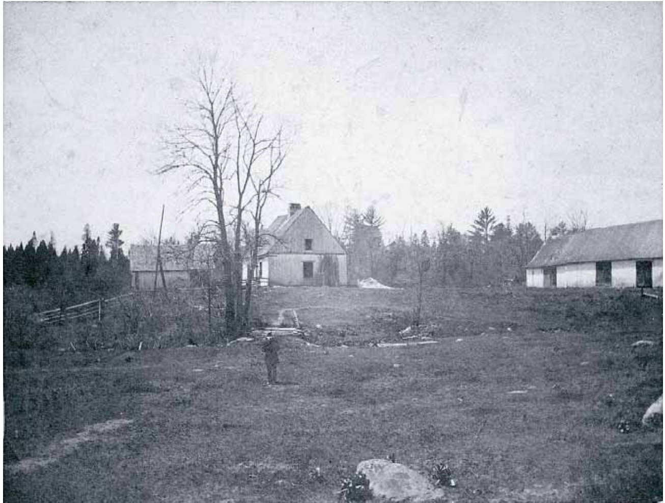
MAISON ROBITAILLE bâtie vers 1830 par Pierre Robitaille (5ème gén.) située sur le lot 522 à Champigny et démolie vers 1898.